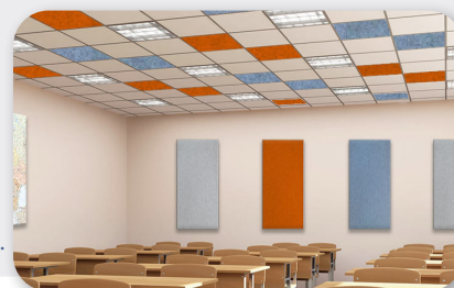
Decke: soni COLOR RD / Wand: soni COLOR